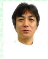
じんけいクリニック