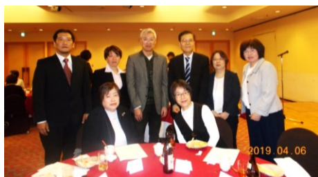
(新年度懇親会：テーブルでの記念撮影)