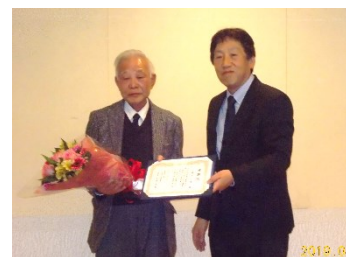
(新年度懇親会：感謝状贈呈)