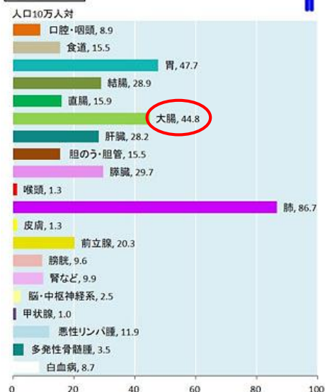
部位別がん死亡率 [男性 2018年]